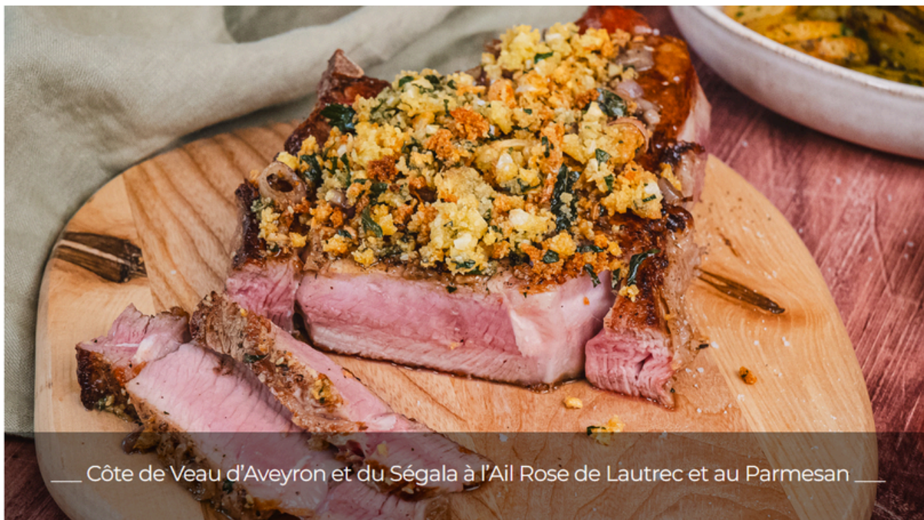
Côte de Veau d'Aveyron et du Ségala à l'Ail Rose de Lautrec et au Parmesan